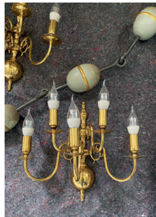
Lampetter og lysekroner blev taget ned i forbindelse med restaureringen.

betydning for, at lyden fra orglet får de bedste forhold: en forkert hynde ville betyde, at lyden nærmest bliver "slugt", fortæller Pia.