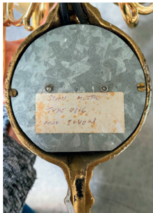
Lampetten med håndskriften bagpå der afslørede, at den var sat op af Pias far.