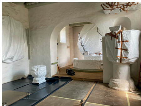
Alle bænke har været taget ud af kirken i forbindelse med restaureringen og præste- og altertavle, døbefont og prædikestol har været indpakket.